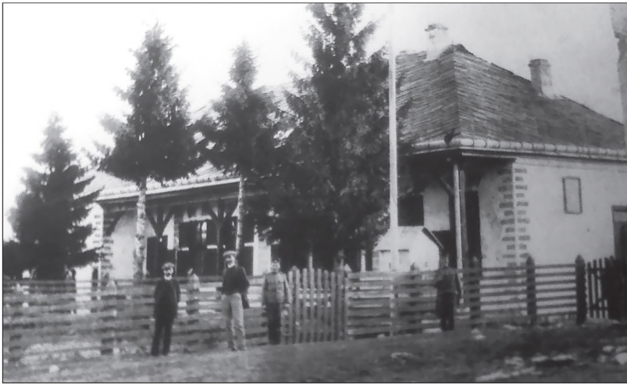
Српска царинарница на Јавору 1912. године