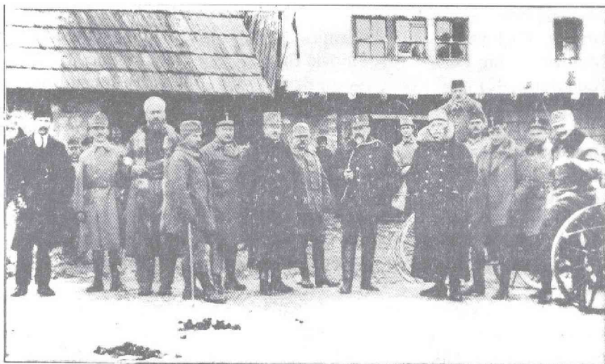
Група аустроугарских официра у Дугој Пољани код Сјенице 1916.