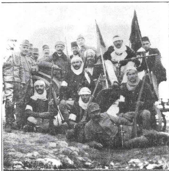
Група ђурумлија из сјеничког краја са аустроугарским војницима 1916.